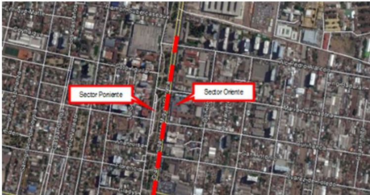
Sector poniente Gran Avenida