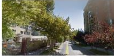
Sector oriente de Gran Avenida